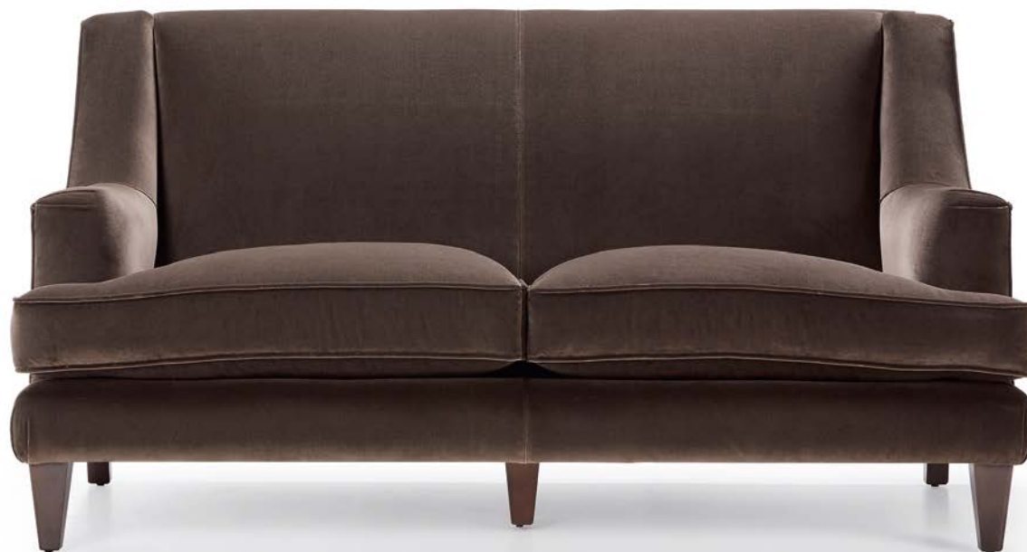
BERG 2P sin tachuelas / BERG 2P without studs / BERG 2P non clouté