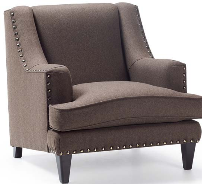
BERG 1P con tachuelas / BERG 1P with studs / BERG 1P clouté

Finition cloutée 20 mm. Option sans cloutage