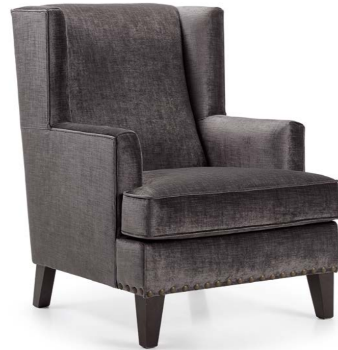
Butaca TEIDE con tachuela sólo en frente / TEIDE armchair with studs only on front / Fauteuil TEIDE clouté sur partie frontale

Patas en madera barnizada Varnished wood legs Pieds en bois verni