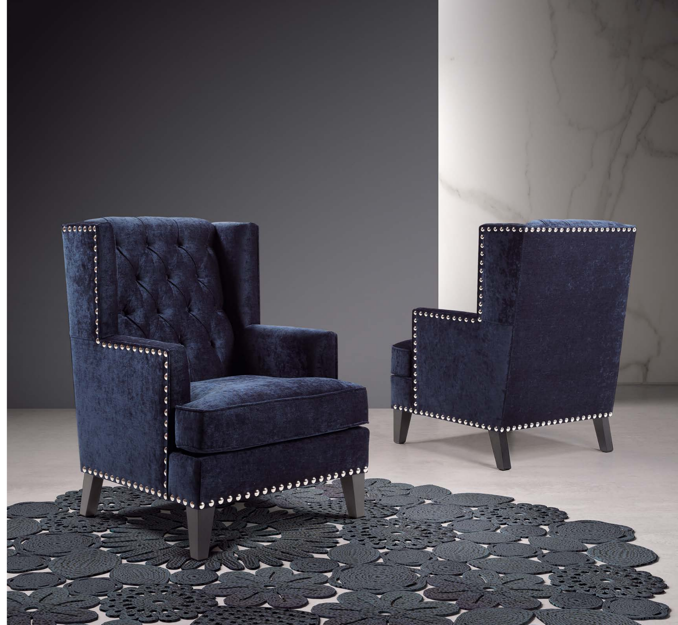
Butaca TEIDE CAPITONE con tachuela alrededor y laterales / TEIDE CAPITONE armchair with studs on sides and around the base / Fauteuil TEIDE CAPITONE clouté tout autour et sur parties latérales