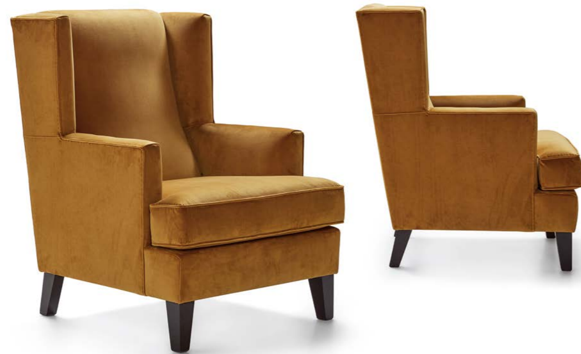
TEIDE sin tachuelas / TEIDE without studs / TEIDE non clouté