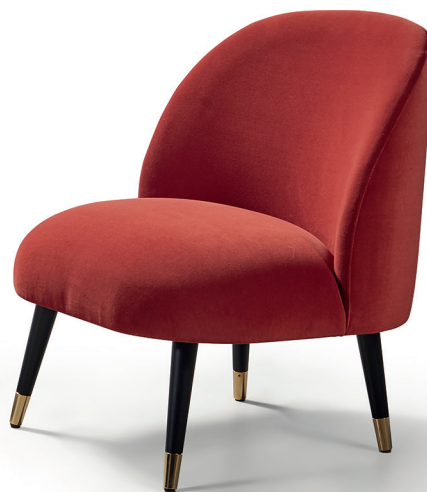
VILM 1P con casquillo / VILM 1P with metal casing / VILM 1P avec culot